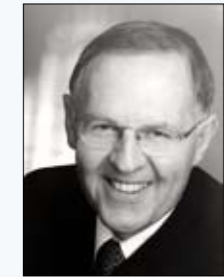
Gerhard Wlodkowski Präsident Landwirtschaftskammer Österreich

Haben sich die Blätter erst einmal weit ausgebreitet, kann der Bauer am Acker nicht mehr viel machen. Ab da muss er sich allein auf die Kraft des Bodens und die Witte-rung verlassen. Während der vier Wochen in denen die Pflanzen ihre männlichen und weiblichen Blüten tragen, brauchen sie viel Sonne. Wenn alles passt, steht der Befruchtung durch Bienen oder Hummeln und einer reichen Ernte im Herbst nichts mehr im Wege.