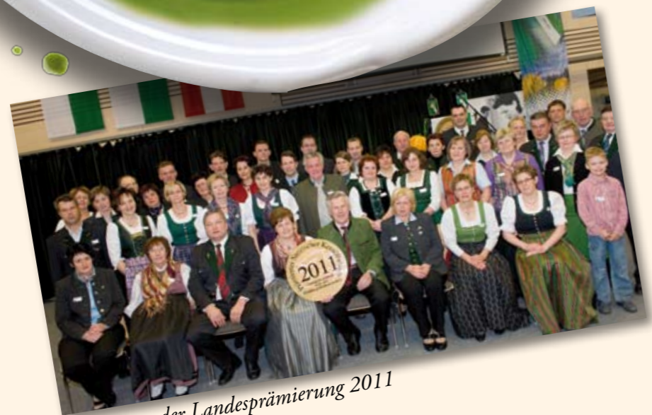
Die Sieger der Landesprämierung 2011