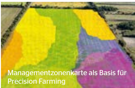
Managementzonenkarte als Basis für Precision Farming

Ein effizienter und nachhaltiger Pflanzenbau erfordert kleinräumige Bodeninformationen. Ertragspotenzialkarten, optimierte Aussaat- und Düngekarten, aber auch Bewässerungsmaßnahmen können damit fundiert geplant und erfolgreich umgesetzt werden. Der Bodensensor misst die Leitfähigkeit in Ober- und Unterboden, den pH-Wert und Humusgehalt direkt am Feld. Diese Messwerte werden statistisch ausgewertet und zeigen so Zonen mit unterschiedlichen Bodenarten. Schließlich können Applikationskarten, die auf tatsächlichen Bodendaten basieren, erstellt werden.