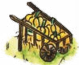
Ein Leiterwagen randvoll mit Kürbissen.