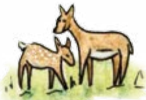
Das Reh mit Kitz.

Mit dem Setzgerät werden die Samen auf dem Feld in Reihen ausgebracht.