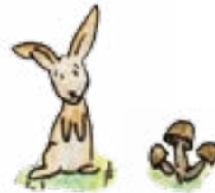
Die Feldhasen verstecken sich, wenn der Traktor kommt.